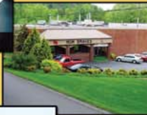
Oben: MGM Produktionsstätte, Murphy, North Carolina Links: MGM Produktionsstätte, Cloverdale, California