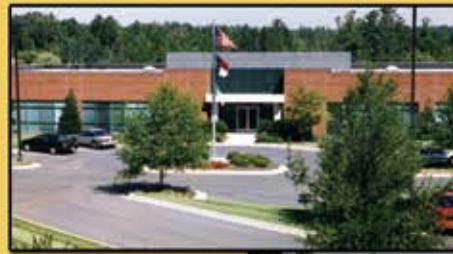
Oben: Die IHV Zentrale Rechts: Das MGM Technische Center beide in Charlotte, North Carolina Unten: Die Entwicklung schreitet unaufhörlich voran bei MGM Brakes

„Führend in der Federspeichertechnologie „ Weltweit