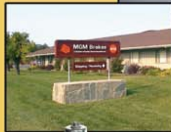
上图：北卡罗来纳州墨菲市的MGM公司刹车制造厂 左图：加利福尼亚州克洛弗代尔市的MGM公司刹车制造厂