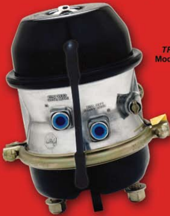
TR-LP3THD Modèle montré

Assure une force de freinage de stationnement supérieure quand vous en avez le plus besoin.