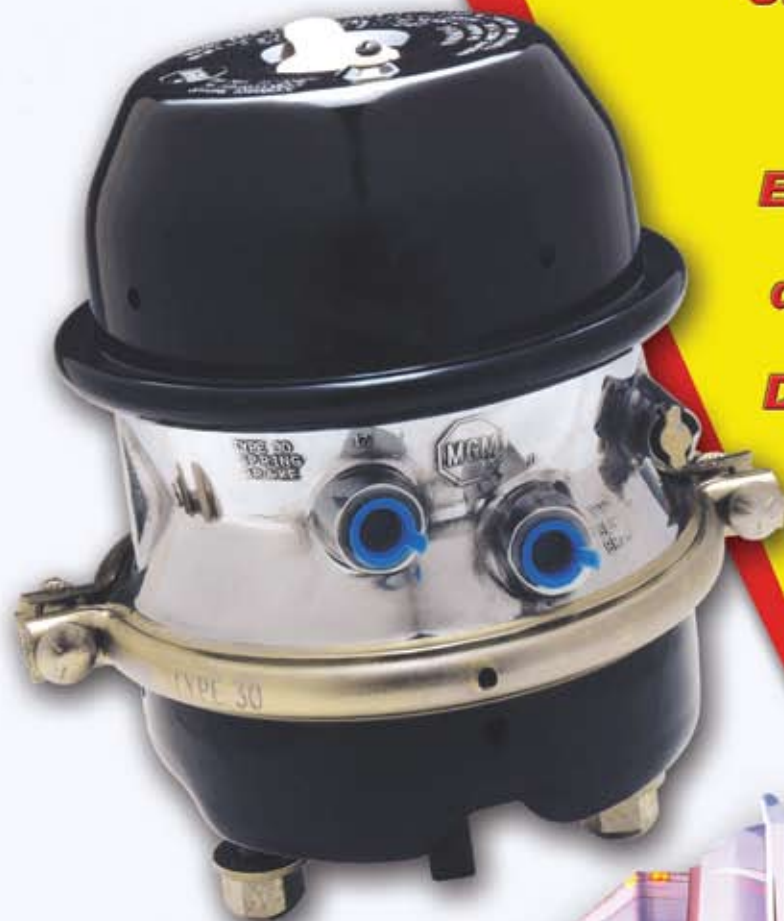
TR-3030 Modelo Mostrado

TR FRENOS DE RESORTE TR ESTÁNDAR EN LA INDUSTRIA