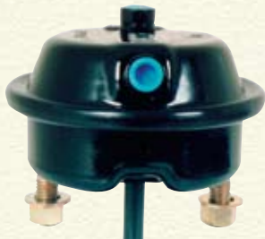
CS16LH (montrée) Entièrement scellée

Remarque : toutes les dimensions sont affichées en pouces et sont assujetties à la modification de la conception.